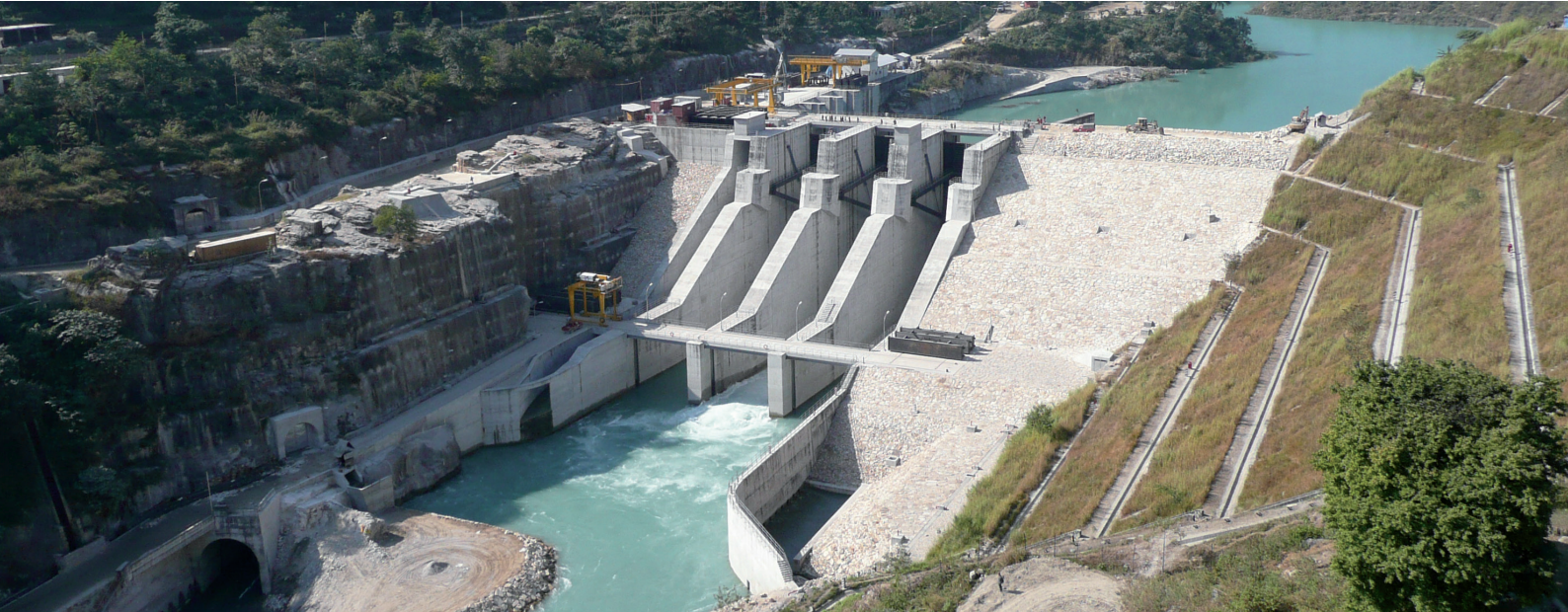
Projekt: Wasserkraftwerk Middle Marsyangdi, Nepal, Bauunternehmer DYWIDAG International GmbH

Allplan Gelände richtet sich an Architekten, Stadt- und Landschaftsplaner sowie Bauingenieure. Im Zusammenspiel mit Allplan Architektur oder Allplan Ingenieurbau können Hoch- und Tiefbauten unter Berücksichtigung des realen Geländeverlaufs, des städtebaulichen Umfelds und des umgebenden Straßennetzes effizient geplant werden.