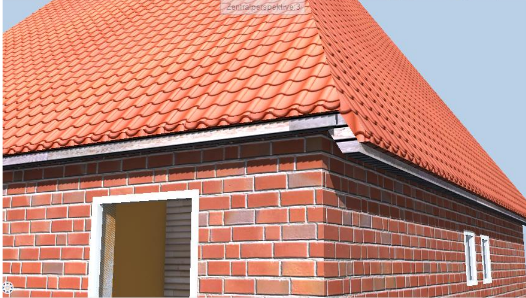
Ansicht von vorne, Süden:2